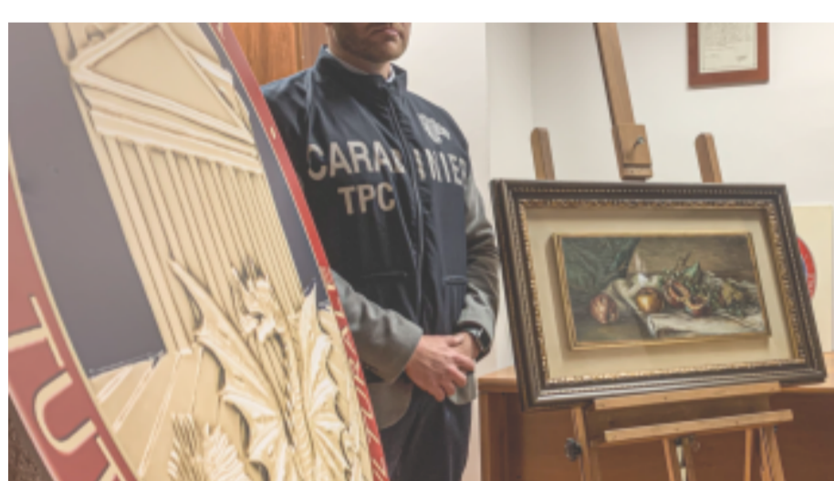
1 Carabinieri per la Tutela Patrimonio Culturale restituiscono dipinto di Giorgio De Chirico 7 Giugno 2022