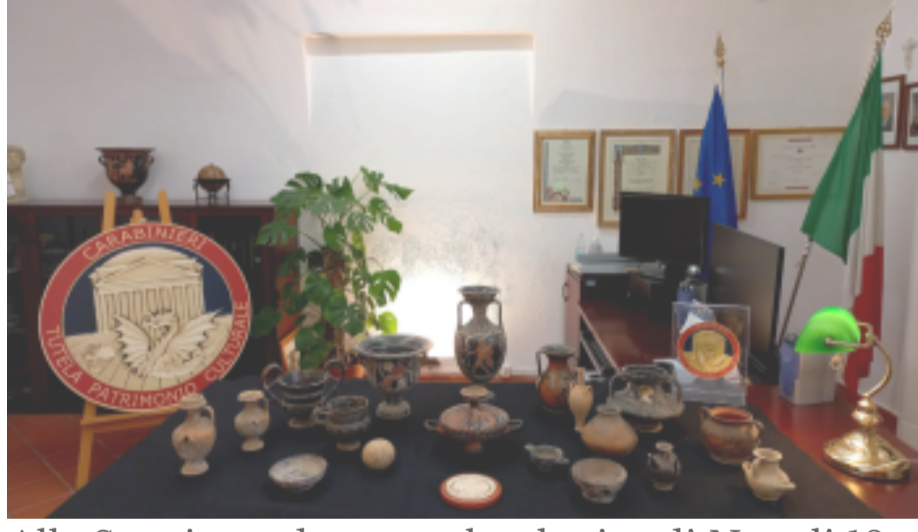
Alla Soprintendenza archeologica di Napoli 18 reperti archeologici sequestrati a un privato collezionista e provento di scavi clandestini 9 Aprile 2022