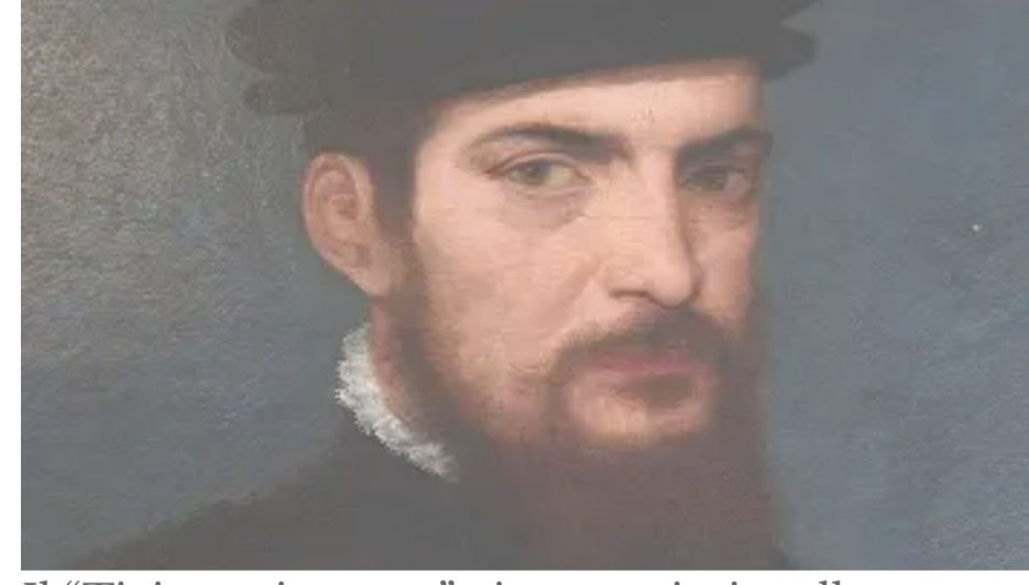
Il "Tiziano ritrovato" viene restituito allo Stato dai Carabinieri TPC 15 Maggio 2022